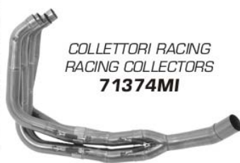
COLLETTORI RACING RACING COLLECTORS 71374MI