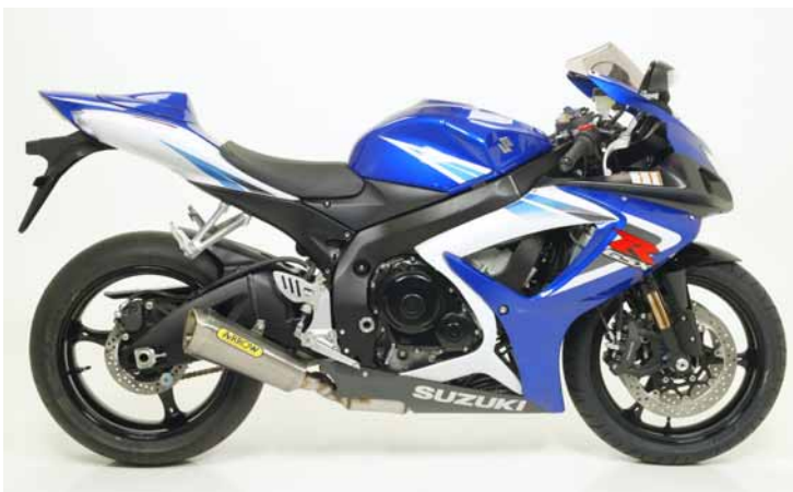
EUROPEAN CUP REPLICA